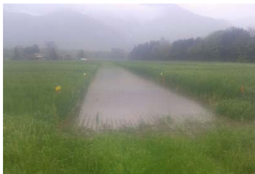
Le passage de visite inondé avec les orges au premier plan

Les orges ont bien supporté la météo capricieuse de ce printemps avec plus de 200 l/m 2 en 48 heures et des parcelles inondées durant plus de 3 jours.