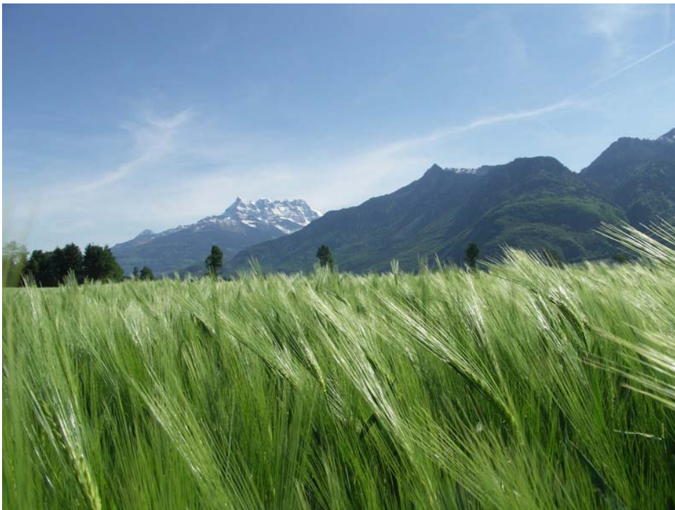
Plate-forme Les Barges Résultats des orges 1896 Vouvry/VS

Exploitants : Groupement d'agriculteurs de Vouvry